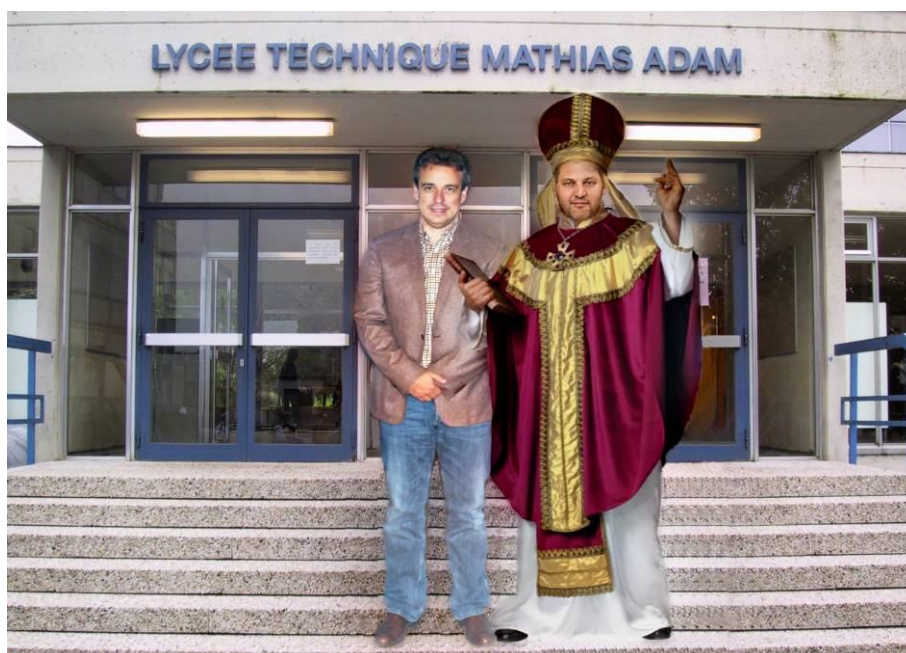
De Minister an de Bëschof op der aaler Traap vum LTMA

A well den 11. Januar 2014 op der Trapp vum aalen LTMA souwuel onsen neien Unterrichtsminister Claude Meisch an den Hubert Hollerich präsent woren, hätt och folgende Collage vum Rollo e Schnappschoss kënnen sin: