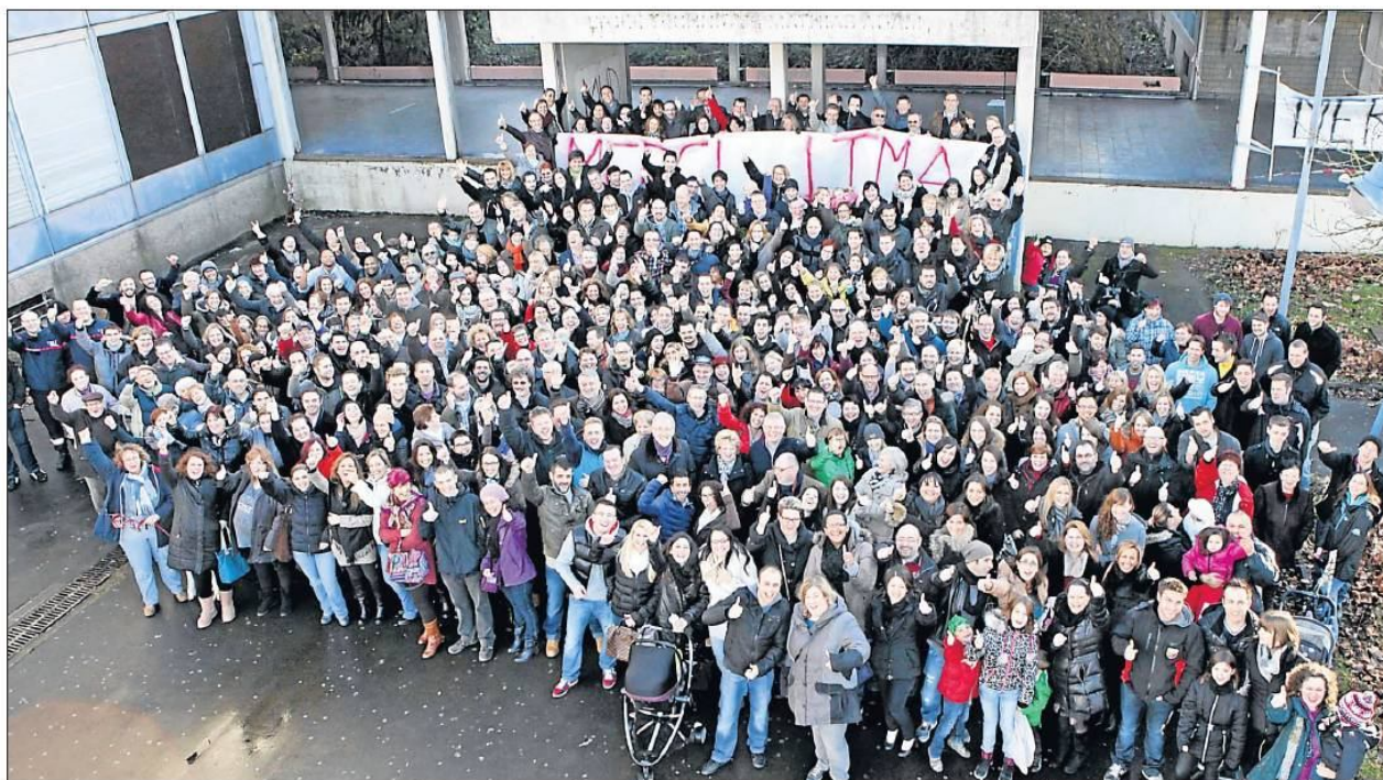
200 ehemalige Schüler aus dem LTMA versammelten sich am Samstag vor der Schultreppe, um von dem Schulhaus Abschied zu nehmen.

Seitdem die 2 000 Schüler des „Lycée Technique Mathias Adam“ (LTMA) Pétingen im Jahre 2008 in ihr neues Schulgebäude an der Porte de Lamadelaine umgezogen sind, wartet das 1967 in Betrieb genommene LTMA auf seinen Abriss.