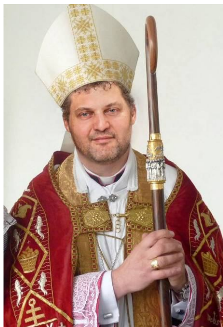
Bëschof Hubert Hollerich

Ween elo de Witz vun deem Collage net versteet, muss wëssen, dass an der Radiosendung "Dossier vum Dag" um 100,7 vum 26.11.2013 de Bëschof Jean-Claude Hollerich vum Journalist irtëmlech Hubert Hollerich gedeeft gouf.