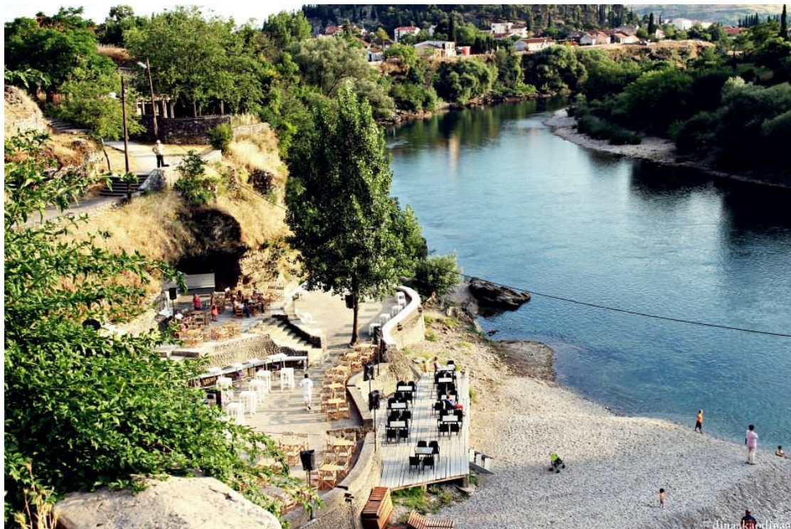
Podgorica, Montenegro, juillet 2013