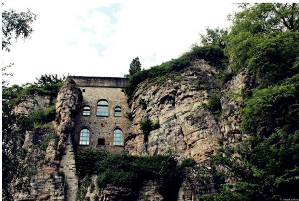
Luxembourg, juin 2013