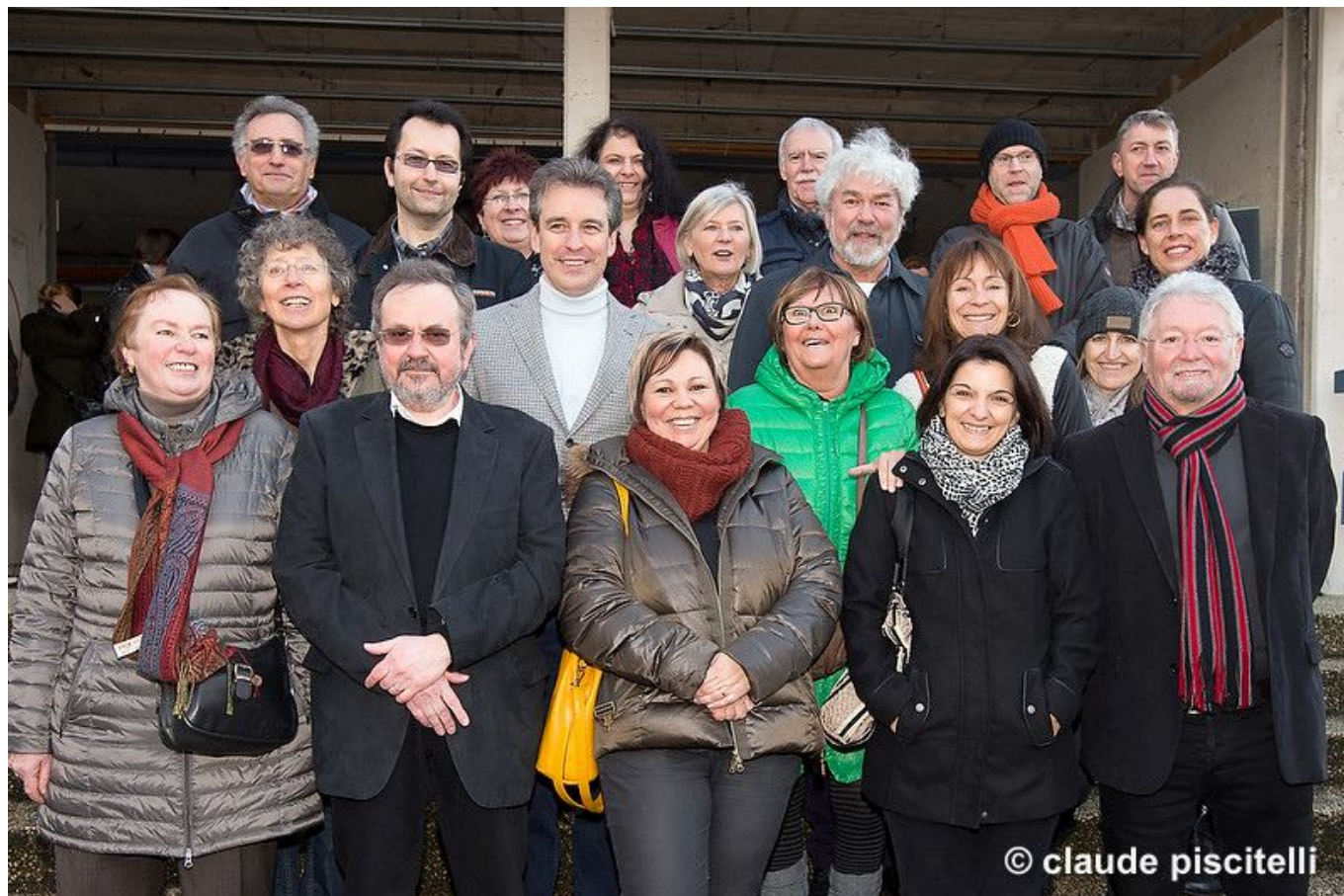
Unter den Anwesenden war auch der neue Unterrichtsminister Claude Meisch

http://www.journal.lu/article/e-ganz-besonesche-lycee/