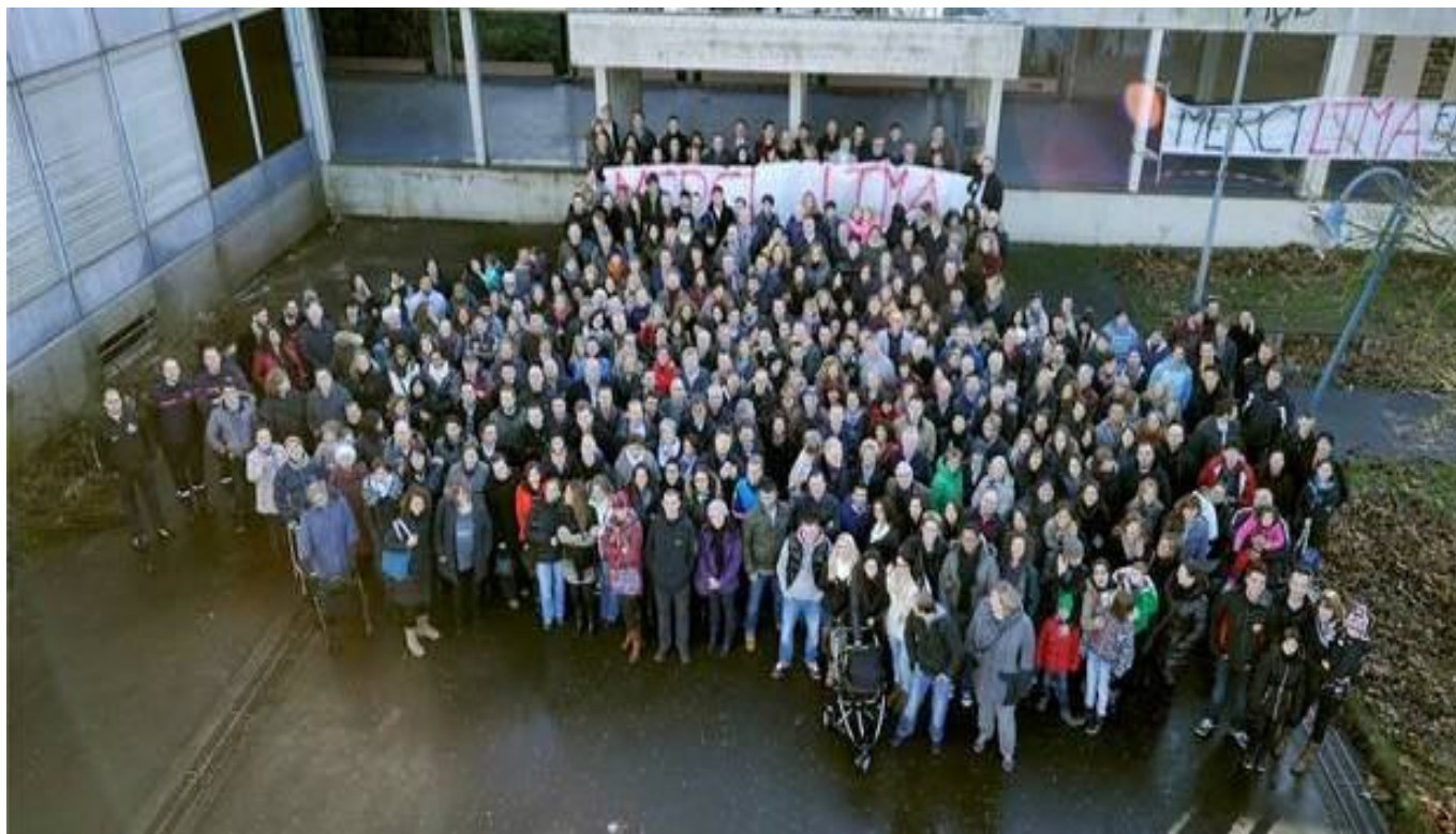
Frühere Lehrer und Schüler des LTMA hatten sich vor Ort eingefunden