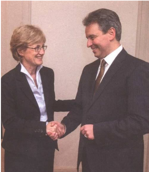
Claude Meisch 2013 : nouveau ministre de l'Education nationale, de l'Enfance et de la Jeunesse, de la Recherche, de l'Enseignement supérieur.

Et nous lui souhaitons beaucoup de courage et de succès dans ce dossier plutôt épineux de la politique nationale ... ☺